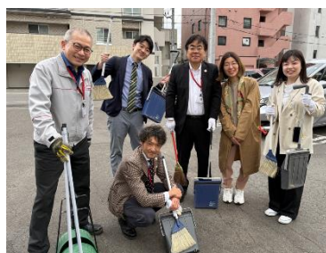
▲商店会清掃活動への参加