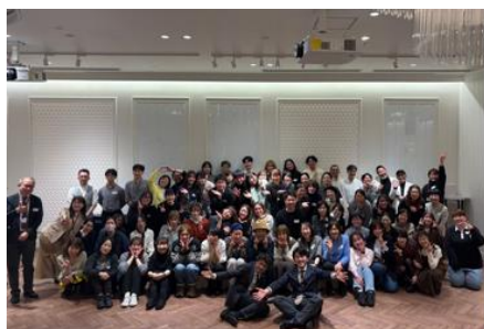
▲テナント従業員懇親会開催時の集合写真と懇親会時に実施したテナント表彰