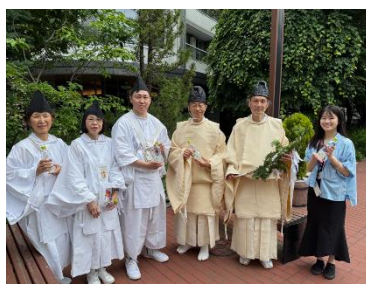
▲北海道神宮例祭での協賛活動