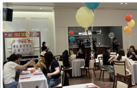
▲サマーパーティ開催時の様子