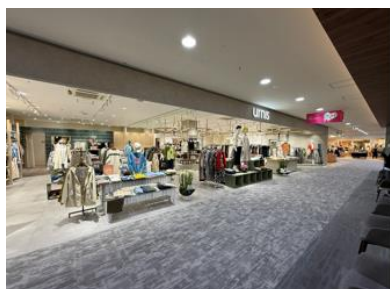
▲店内改装を実施した「furnis」