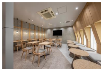
▲2024年に大改装した「従業員休憩室」

多くの北海道内企業が出店し、円山エリアの特性を生かした店舗展開を進めてきました。また、テナントスタッフの働きがい向上を目的に、従業員休憩室の改装や商戦期における運営サポートなど、スタッフへの感謝と応援の気持ちを込めた支援策を通して協働意識の醸成にも取り組んでいます。これらの継続的な活動が評価され、地域貢献賞を受賞しました。