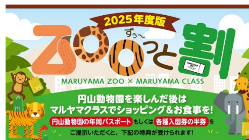
▲円山動物園との連携施策