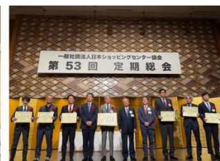
▲地域貢献賞授賞式の様子