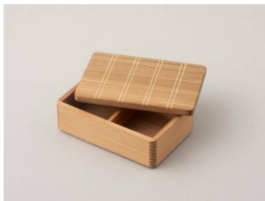
④ Studio Kirin 山武杉のお弁当箱 格子 大 450ml