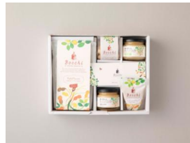
③ Bocchi 畑で採れたギフトボックス<5点セット>