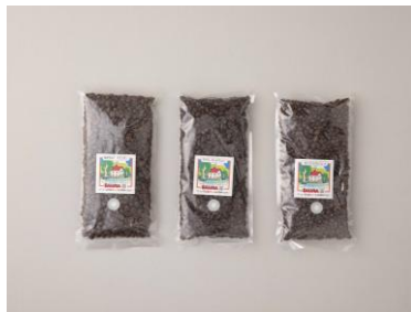
② サルビアコーヒー スペシャルティーセレクト200g×3パック