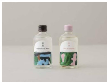
⑤ mitosaya LIBATIONS 100ml×2本セット