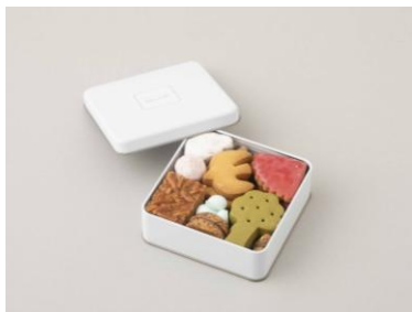
① donner 海と里山のクッキー缶