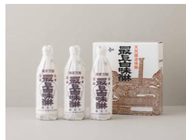
⑥ 馬場本店酒造 最上白味麴600ml 3本 箱入り