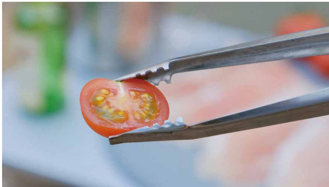
柔らかいトマトや生ハムも、大き目の木の枝や分厚いお肉も持てる独自形状のマルチファンク

先端部には、細かな具材から厚切りステーキまでしっかりキャッチできる独自形状「マルチファンク」を採用。プレスを最小限に押さえたホールド感とあいまって、やわらかい食材を優しくつかむ繊細さと、分厚い肉や大きな燃料をしっかり保持できる力強さを発揮します。調理に焚き火に幅広いシーンで活躍する万能トングの誕生です。