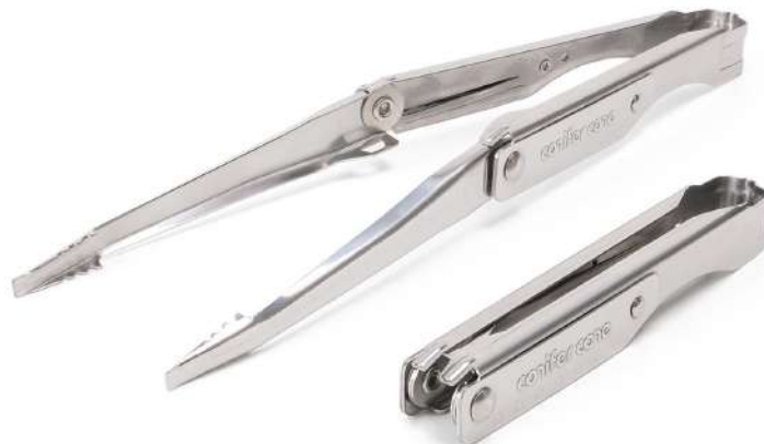
手に取りやすい価格のスタンダードモデル「フォールディング ロック tong」

実用性を求める人にも、ギアを“育てる”楽しさを味わいたい人にも応える、新しい tong シリーズです。