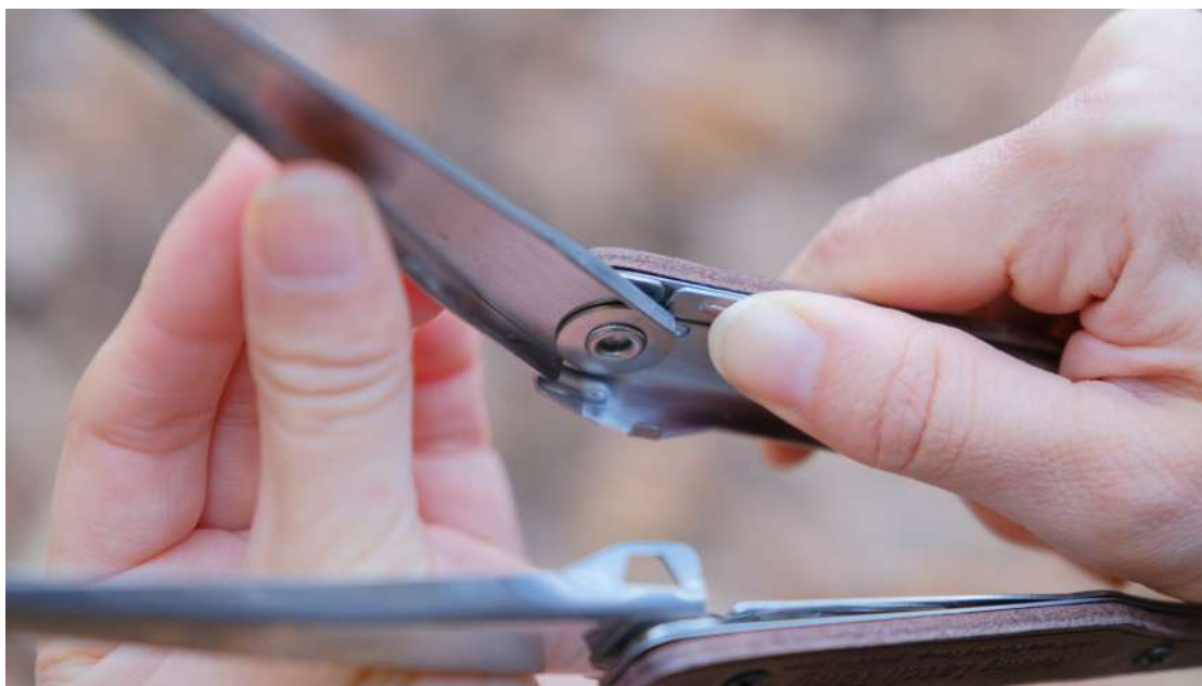
先端を回転させることでカチッとハマってロック。手前のロックバーを押してロックを解除しながら回転して収納する

展開時には「カチッ」と小気味よいクリック感とともにしっかりとアームがロックされ、使用時のガタつきを抑えます。しっかりとしたホールド感が手の延長のような安定感を生み出します。