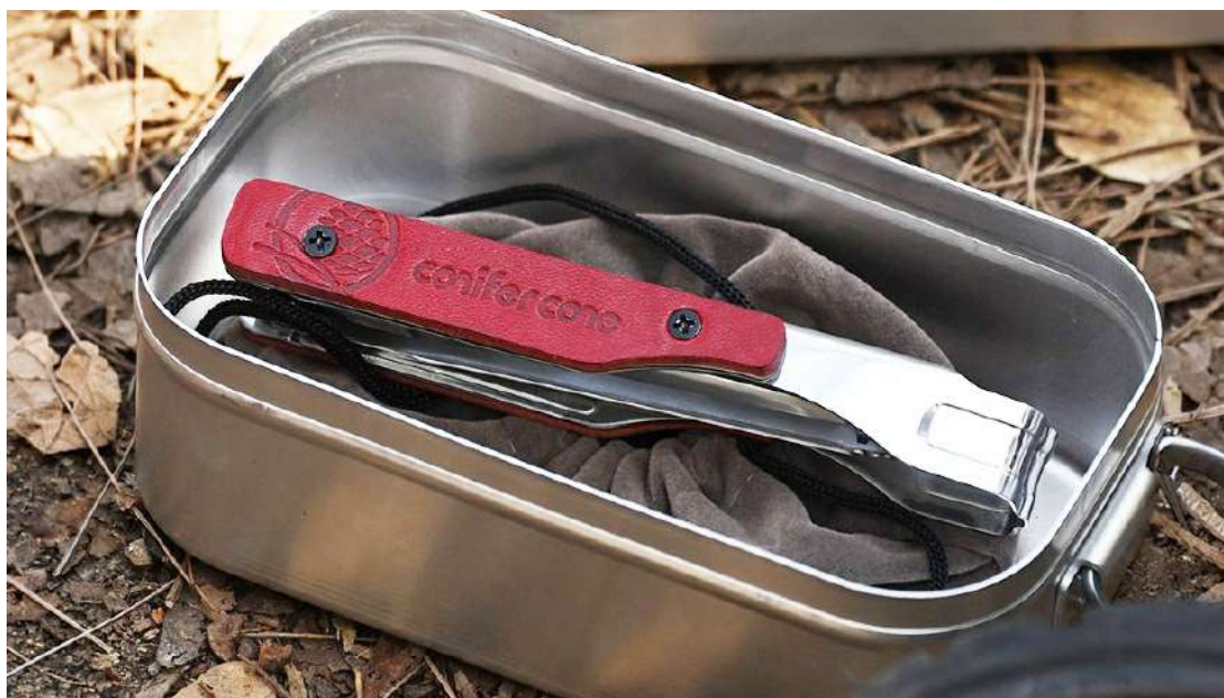
収納時はメスティンに収まる超コンパクトサイズ

調理にも使いやすい 260mm の長さを確保しながら、収納時は 142mm までコンパクトに折りたたむ構造はコニファーコーンならではの。メスティンや小型ポーチにも収まる携帯性は、ソロキャンプやミニマルキャンプを好むユーザーにとっても大きな魅力です。