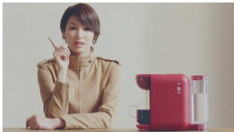
『UCC DRIP POD』篇