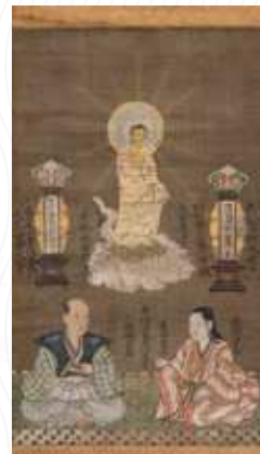
長尾政景夫妻像 (常慶院・米沢市) 後期