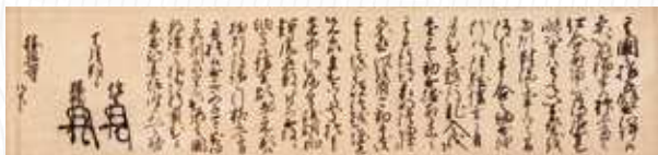
【富山県指定文化】勝興寺文書 (元亀3年・1572)10月1日 勝興寺宛武田信玄・勝頼連署状 (勝興寺・高岡市) 後期