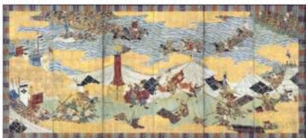
川中島合戦図屏風(長野県立歴史館・千曲市) 前期