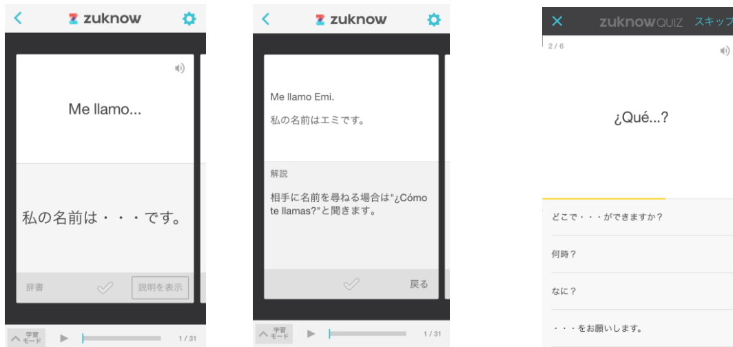
「スペイン語 旅行フレーズ」カード学習画面（右：表面、左：裏面）

本コンテンツでは、「スペイン語圏への旅行の基本フレーズ」「家族」「食べ物」「飲み物」といったシーン別に使えるフレーズを合計約100フレーズ公開しています。ユーザーは、海外旅行に行く前の隙間時間に、スマートフォンでスペイン語会話を学習できます。