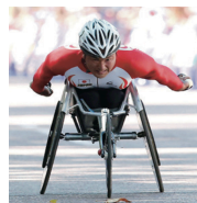
副島 正純 選手

全盲のスーパーアスリート。 視覚障害者 800m を 2分 10.38 で走る日本記録保持者。 IPC 陸上競技世界選手大会5位入賞。 インチョン 2014 アジアパラ大会など、世界中の大会に選抜。