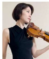
NANA ヴァイオリニスト