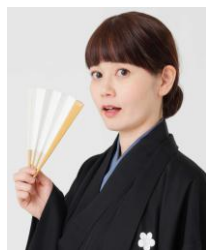
金原亭杏寿 女性落語家