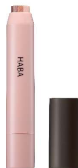
『グラデシャドウスティック (ブロッサムブラウン)』 2,200 円(税込)

『グラデシャドウスティック(ブロッサムブラウン)』は、まぶたに沿って滑らせるように塗るだけで、3色のグラデーションメイクが簡単に完成するスティックタイプのアイカラー。深みのあるブラウンに、春らしいピンクを組み合わせることで、目元をやさしく、洗練された印象に導きます。保湿成分スクワランを配合し、目元にうるおいを与えながらしっとり密着。コンパクトなスティックタイプで持ち運びやすく、忙しい朝のメイクはもちろん、外出先でのメイク直しにも活躍するアイテムです。