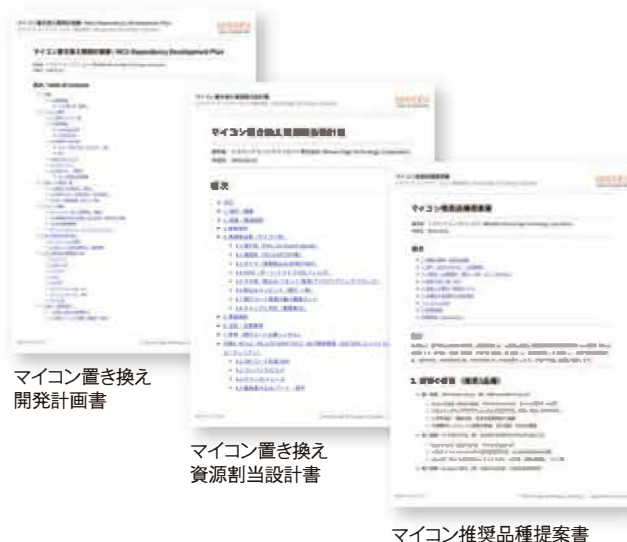
マイコン置き換え 開発計画書