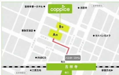
[コピス吉祥寺アクセス MAP]