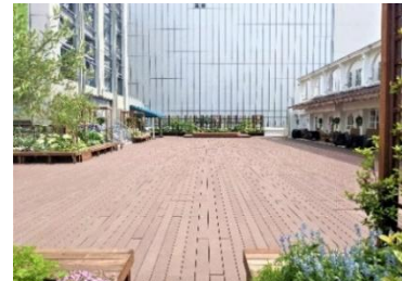
[A 館 3 階屋外スペース「GREENING 広場」]