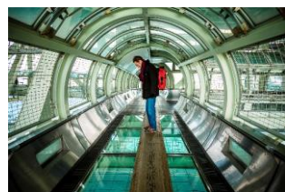
舞子海上プロムナード

舞子は、神戸市垂水区の海沿いに位置し、神戸の中心地・三ノ宮駅から電車で約20分とアクセスしやすい観光エリアです。最大の見どころは、明石海峡大橋と、その向こうに広がる淡路島の美しい景観。舞子公園には、海辺の遊歩道や展望施設「舞子海上プロムナード」があり、橋の迫力を間近で体感できます。