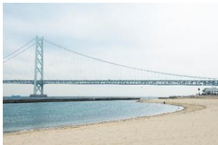
明石海峡大橋（昼）