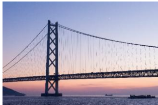
明石海峡大橋（夕方）