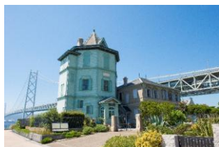
孫文記念館