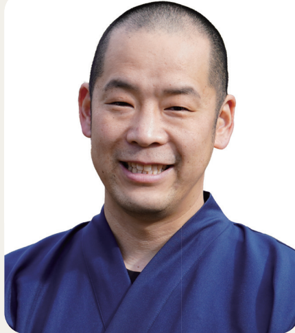
般若寺(はんによじ) 住職

斑鳩町にある浄土宗の寺院で、別名「ぼっくり寺」として信仰を集める古刹。本尊の丈六阿弥陀如来像と境内の多宝塔が重要文化財に指定されている。