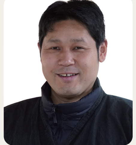
氷室神社(ひむろじんじや) 権禰宜

奈良市にある真言律宗の寺院で、飛鳥時代に創建された古刹として知られる。「花の寺」として季節ごとの花に彩られ、多くの参拝者を迎える。