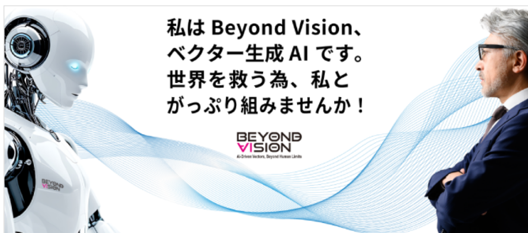
ベクター生成AI『Beyond Vision』提携事業

近年成長が目覚ましいカスタムアパレル分野において、ベビーユニバースと共に『Beyond Vision』の市場を拡大いただけるパートナー企業様を国内外より募集し、大量廃棄や人材不足といったアパレル業界が抱える課題の解決を目指します。