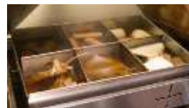
[内容] おでんの販売