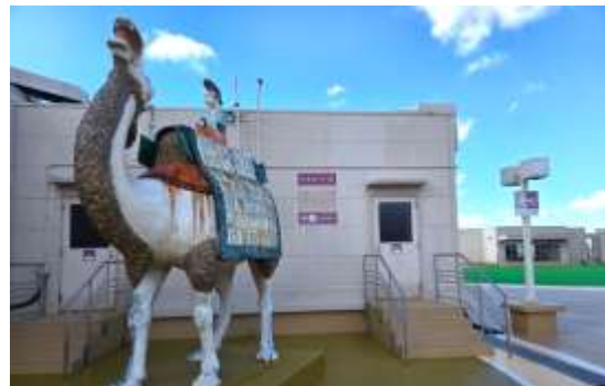
（リニューアル後の屋上）

『屋上広場 ～ポコラの庭～』は、世代を超えて人々の波動が作用しあい、新たな物語を紡ぐ場として、地域の皆さまに寄り添い続けます。