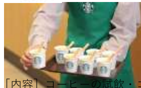
[内容] コーヒーの試飲・コーヒー豆などの販売 ※時間 12:00～