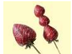
[内容] いちごの販売