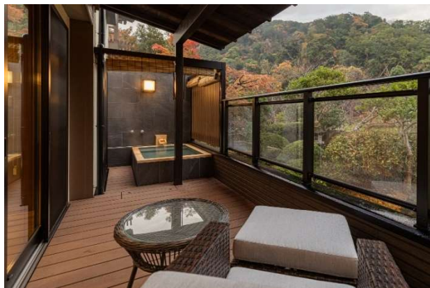
【メゾネット】テラス・露天風呂