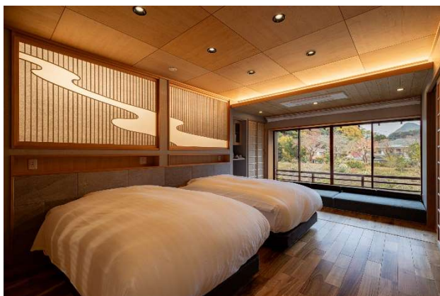
【メゾネット】露天風呂付スイート ツイン