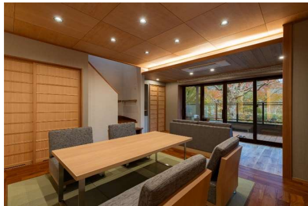
【メゾネット】露天風呂付スイート 和洋室