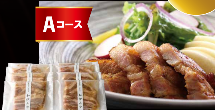
麓山高原豚味噌漬