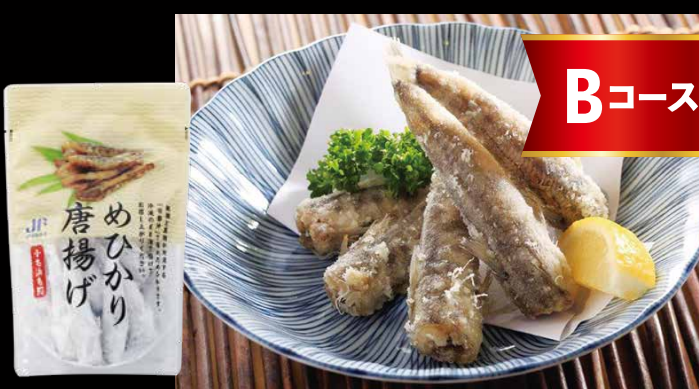
メヒカリ唐揚げ・メヒカリ開き