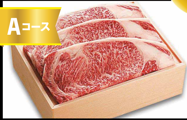
福島牛サーロインステーキ