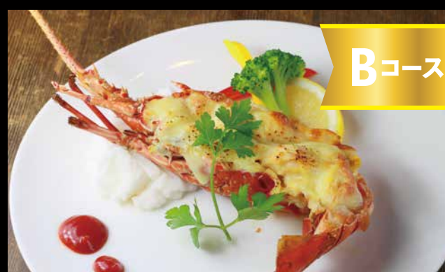
常盤もの伊勢海老