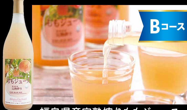
福島県産完熟搾りももジュース