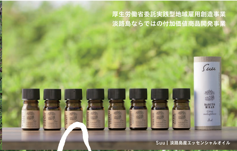
Suu | 淡路島産エッセンシャルオイル