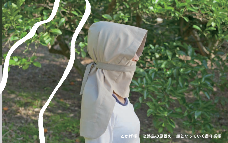
こか帽 | 淡路島の風景の一部となっていく農業帽