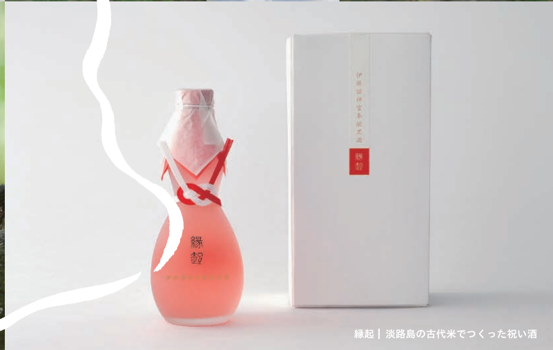
縁起 | 淡路島の古代米でつくった祝い酒