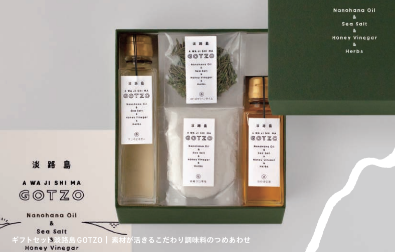
淡路島 A WA J I S H I M A GOTZO Nanohana Oil & Sea Salt ギフトセット 淡路島 GOTZO | 素材が活かせるこだわり調味料のつめあわせ Honey Vinegar