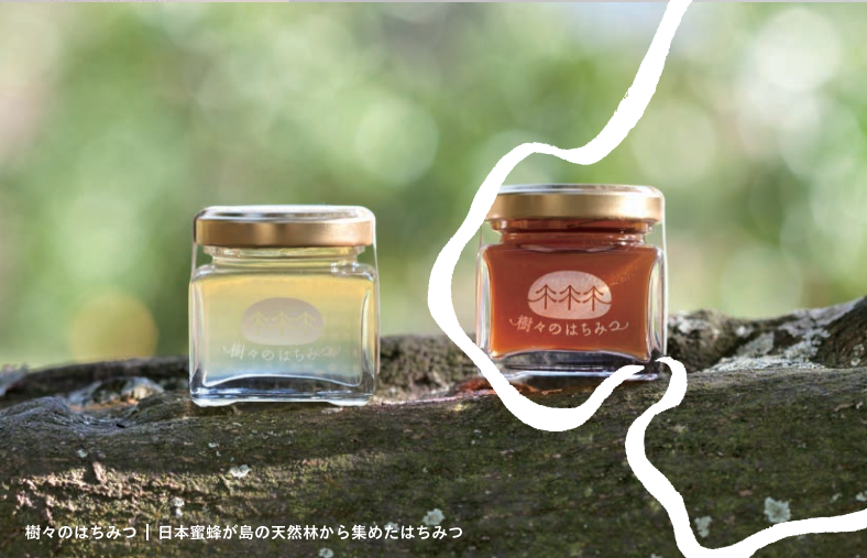
樹々のほちみつ | 日本蜜蜂が島の天然林から集めたほちみつ