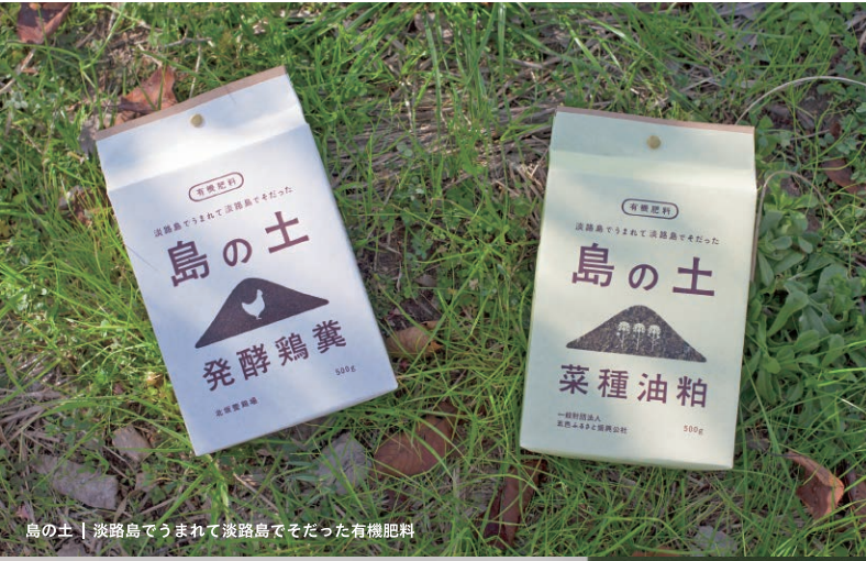
島の土 | 淡路島でうまれて淡路島でそだった有機肥料