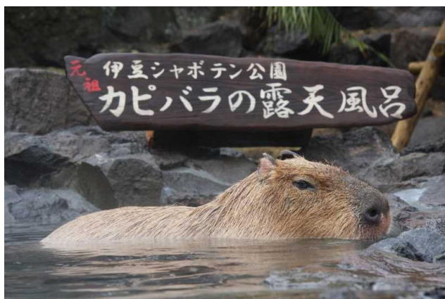
【伊豆シャボテン公園】