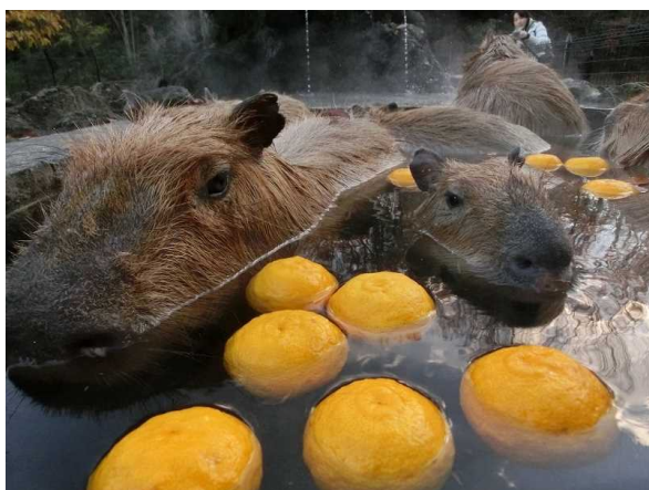
【埼玉県こども動物自然公園】