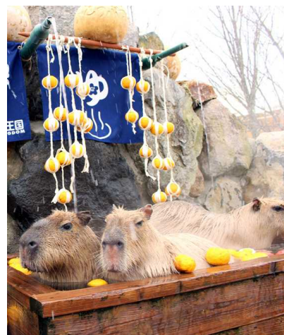
【那須どうぶつ王国】