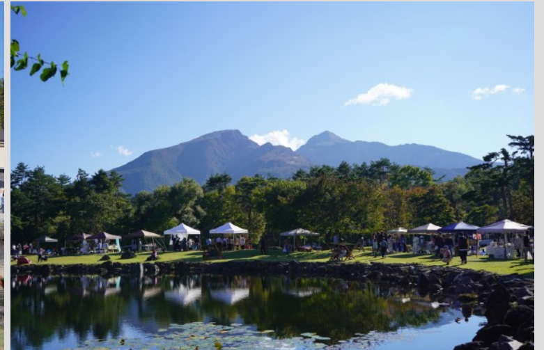
抜群のロケーション