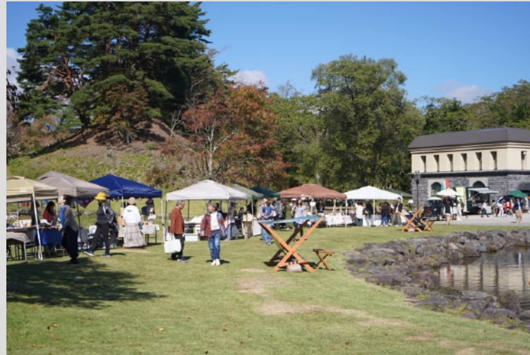
庭園エリアを利用