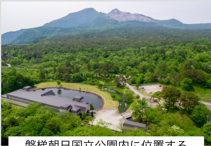
磐梯朝日国立公園内に位置する 美術館のロケーション