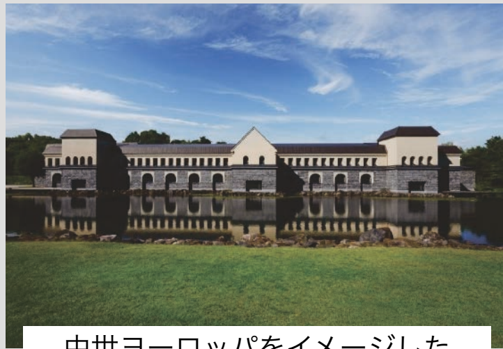
中世ヨーロッパをイメージした 建物