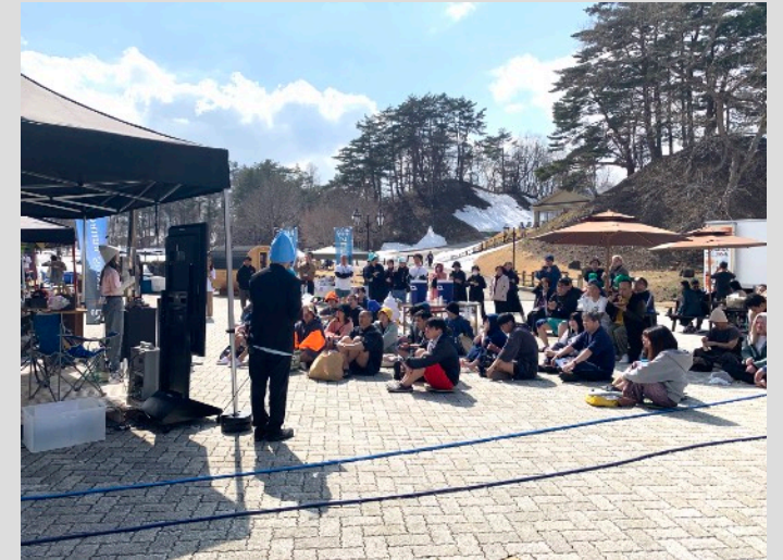
ゲストを招いてのイベント