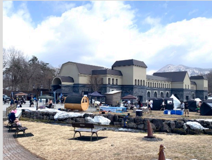
さまざまなサウナが出店