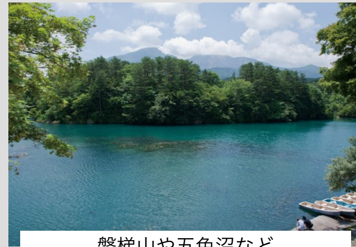
磐梯山や五色沼など 豊かな自然環境