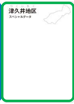
グリーンカード フリースタイル

特設サイトにログイン http://www.print-nisso.com/pcs/