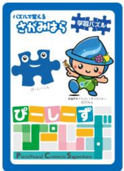
ブルーカード 問題入り