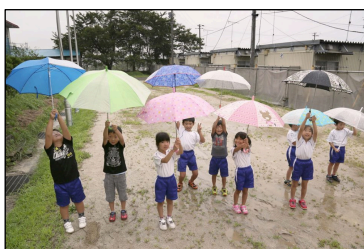
校庭がテニスコートほどしかない 岩手県宮古市立赤前小学校 (子ども達がいるところが校庭)

博報堂アイ・スタジオはこの状況を鑑み、被災校支援を行なっているウェブベルマーク協会と連携し、一日も早い学習環境の改善につながるよう支援活動を開始いたしました。