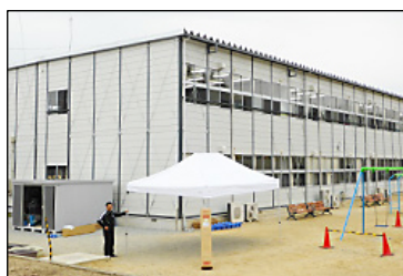
未だに仮設校舎の福島県南相馬市立 小高小学校