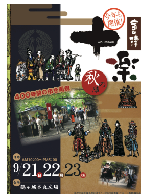
「會津十楽」公式画像

約400年前に蒲生氏郷によって鶴ヶ城下に敷いた「十楽」という制度を現代に再現したイベントです。当時の食文化、当時の食を再現した「食楽」、匠の技を展示・販売する「匠楽（しょうらく）」、お伽衆朗読劇や絵付け体験などの「興楽（きょうらく）」、時代衣装を身に纏ったスタッフ、南蛮寺をイメージしたオリジナルデザインの南蛮小屋（ブース）など、約400年前にタイムスリップしたかのような雰囲気味わうことができます。