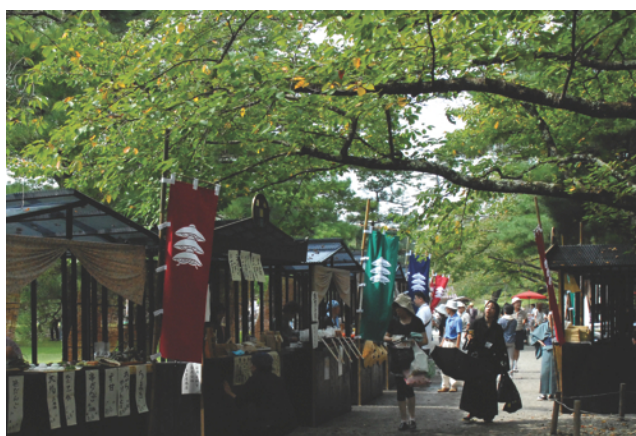
2013年に開催されたイベント「會津十楽」

9月24日には、会津若松市内の事業者を対象とした導入支援セミナーを実施いたします。その後も同エリアで複数のセミナーを実施する予定となっており、年内に「Coiney」を会津若松市内の100店舗以上に導入することを目指します。それに伴い、10月より半年間に渡り、通常営業時での実証実験も開始し、Coiney導入前後で消費額の変動等の効果検証をアクセントとともに進めます。また、今回の実証実験における「Coiney」を利用して得た収益の一部を会津若松市の地域活性化のために還元していきます。