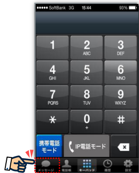
① 「メッセージ」をタップ