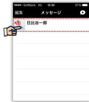
② 「メンバーリスト」から送信先を選択*