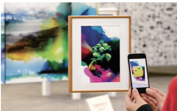
©2013 AKAMATSU Masayuki and ARART Project All Rights Reserved.

この“美術館”は、パネルや立方体に描かれた絵画を携帯端末をとおして鑑賞する。近年一般的になってきたAR（拡張現実）技術によって、私たちが見ている現実には新たな視点と疑問を投げかける。