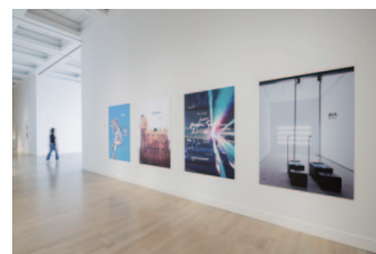
平成25年度〔第17回〕文化庁メディア芸術祭受賞作品展