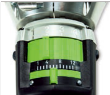
トルク設定48段階(4ギア12ステップ)