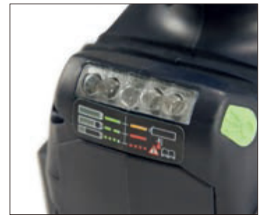
標準付属：バッテリー2個付き

The desired torque is set by toggling the gear steps (1 to 4) and operating the setting potentiometer (steps 1 to 12) at the housing above the handle. Refer to the included torque tables for the necessary set value.