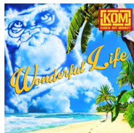
セカンド・シングル Wonderful Life

7月23日にリリースするニューシングル「Wonderful Life」がSHONAN OPEN 2014のイメージソングに決定している。