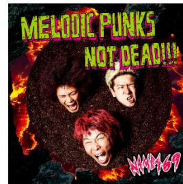
デビューシングル MELODIC PUNKS NOT DEAD!!!

PUNKSPRING、FUJI ROCK FES、京都大作戦などの大型イベントに立て続けに出演。自主企画"PUNK ROCK THROUGH THE NIGHT"は各地ソールドアウトさせる。待望のデビューシングルが2014年6月9日に発売!