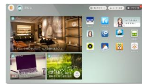
スタンダードスタイル