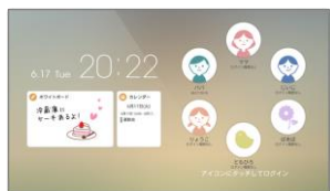
ロック画面(ユーザ選択画面)

今後もこの「スマート光ライフアプリ」を入り口として、タブレット向けサービスのラインナップを拡充し、次々に新たな利用シーンを提案していきます。