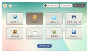
シンプルスタイル