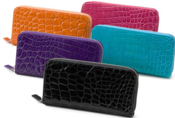
鈴木紗理奈プロデュース クロコダイル財布 18,858円（税抜）