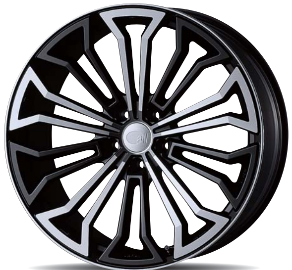
MMB (Matte Machined Black) : 20inch