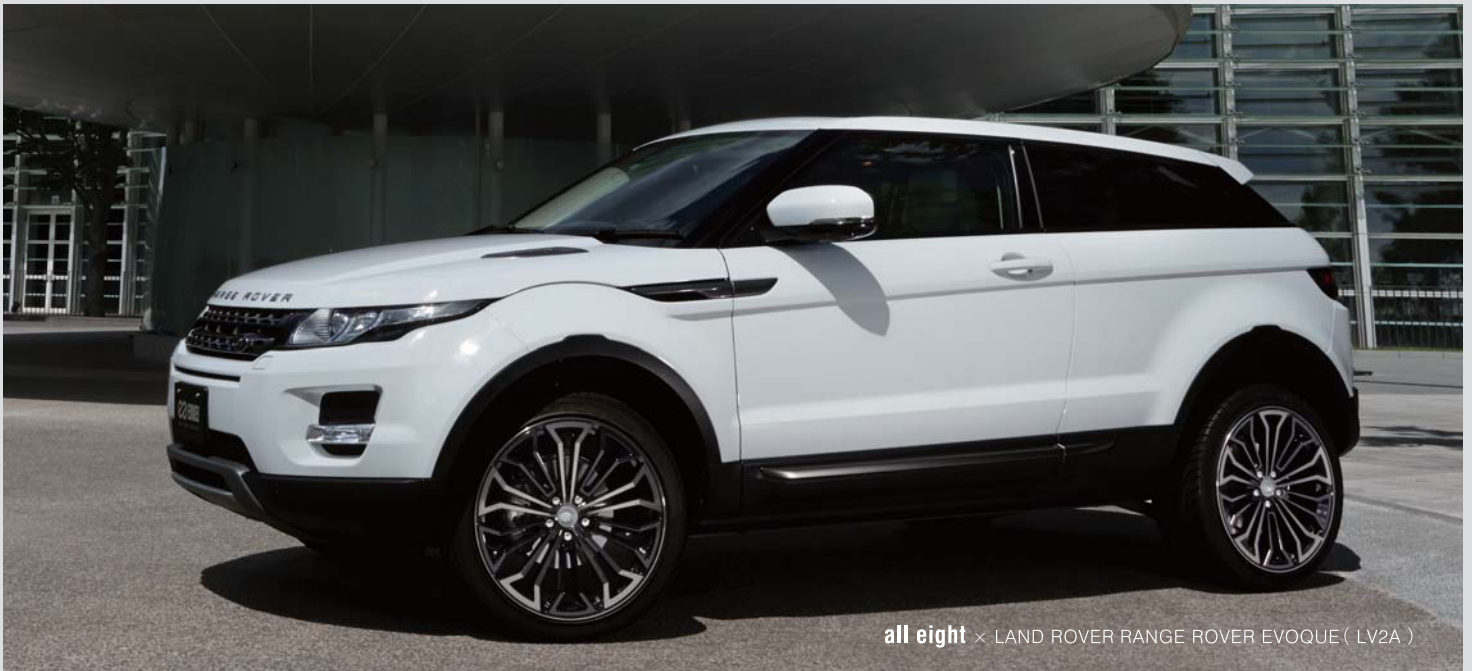
all eight × LAND ROVER RANGE ROVER EVOQUE (LV2A)