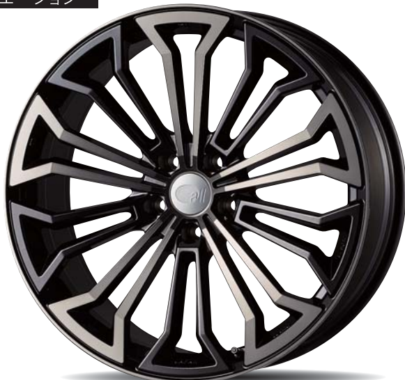
Black Clear : 20inch