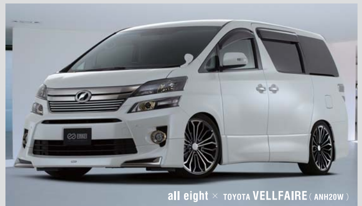
all eight × TOYOTA VELLFAIRE (ANH20W)