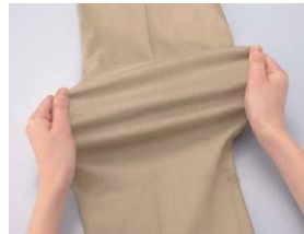
<素材：伸縮イメージ>

天然繊維ならではの、自然なネップ（麻など、繊維の節が生地表面に出たもの）と上品な光沢感、シャリ感が涼しげな麻混素材にストレッチを効かせた、この夏おすすめのパantsが新発売登場。今回発売するのは、センタープレス入りで美しい目に仕上げた「ストレートパンツ」と「テーパードパンツ」、そして、膝上丈で裾幅をやや広めにし、脚の細見せ効果を狙った「キュロットパンツ」の3種類。従来、ゆったりカジュアルにはくイメージの強かった麻混パンツを、今年は「ストレートパンツ」と「テーパードパンツ」の2種類をセンタープレス入りのきれいなラインにし、ヒールと合わせてもはける仕様にしました。また、ストレッチで太ももの窮屈感も少なくなり、今までになかった「心地よさ」と「エレガンス」の両方を叶えたアイテムです。