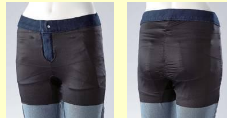
<フロントイメージ>