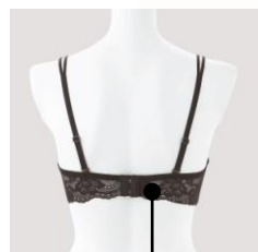
バックは総レースで美しくすっきり。