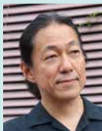
助川 哲也 (ドリアン助川)

私が著した小説「あん」は現在24言語に翻訳され、世界中で読まれています。映画化もされ、カンヌ国際映画祭のオープニングフィルムとなりました。ハンセン病回復者の人生を描いた当作品のテーマは、「積極的感受」による日々の創造です。どのような視点と認識の上で世界を再構成すべきなのか? シュルレアリスム運動と袂を分かった詩人ジャック・プレヴェールの活躍とその創作法、また「老子」全文の訳をある口語体にて試みた結果から見えてきた「無為自然からの創造」など、話題のAIとは別の次元で、心をもう一度見直すところから始まる創造論について語ります。