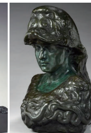
「兜をつけたパラス」