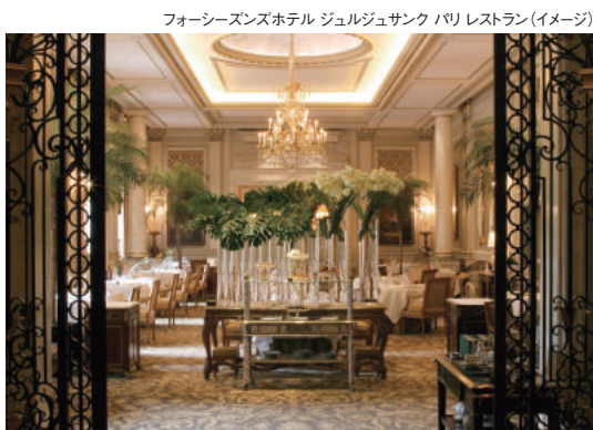
フォーシーズンズホテル ジュルジュサンク パリ レストラン(イメージ)