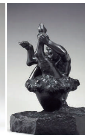
「酒樽のバックカス」