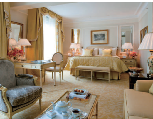
フォーシーズンズホテル ジュルジュサンク パリ フォーシーズンズ・スイート(イメージ)

シャンゼリゼ通りからすぐの好立地にある「フォーシーズンズホテル ジュルジュサンクパリ」。1928年に完成した8階建ての歴史的建造物に、244室の贅沢なゲストルーム、パリの街並みを一望するプライベートテラス、華麗なアートコレクション、デカダンな雰囲気漂う高級ダイニングなど。「光の都」パリでもひととき異彩を放ち、ラグジュアリーな概念を一新するホテルに滞在できる。ホテル内でのディナー、フォーシーズンズ・スイートでのひととき、専用車の利用でくつろぎのパリの旅を楽しもう。