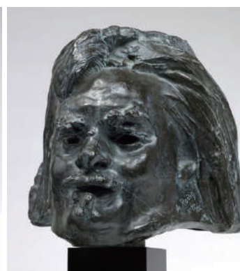
「バルザックの頭部」