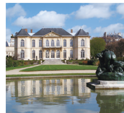
ピロン邸(国立ロダン美術館)

美術商の父を持ち、幼いころから美術品、芸術家に囲まれて育つ。2012年SDアート取締役就任。