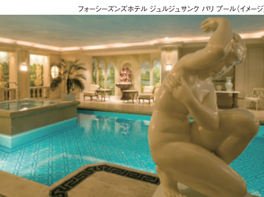
フォーシーズンズホテル ジュルジュサンク パリ プール(イメージ)