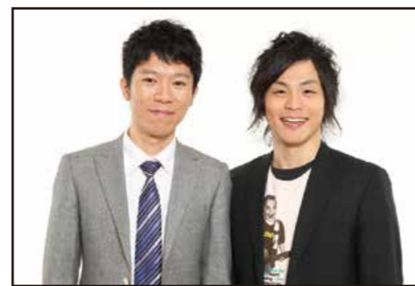
モンスターエンジン

よしもとの若手芸人さんが西土佐にやってきます! サイン抽選会もあります。お楽しみに~