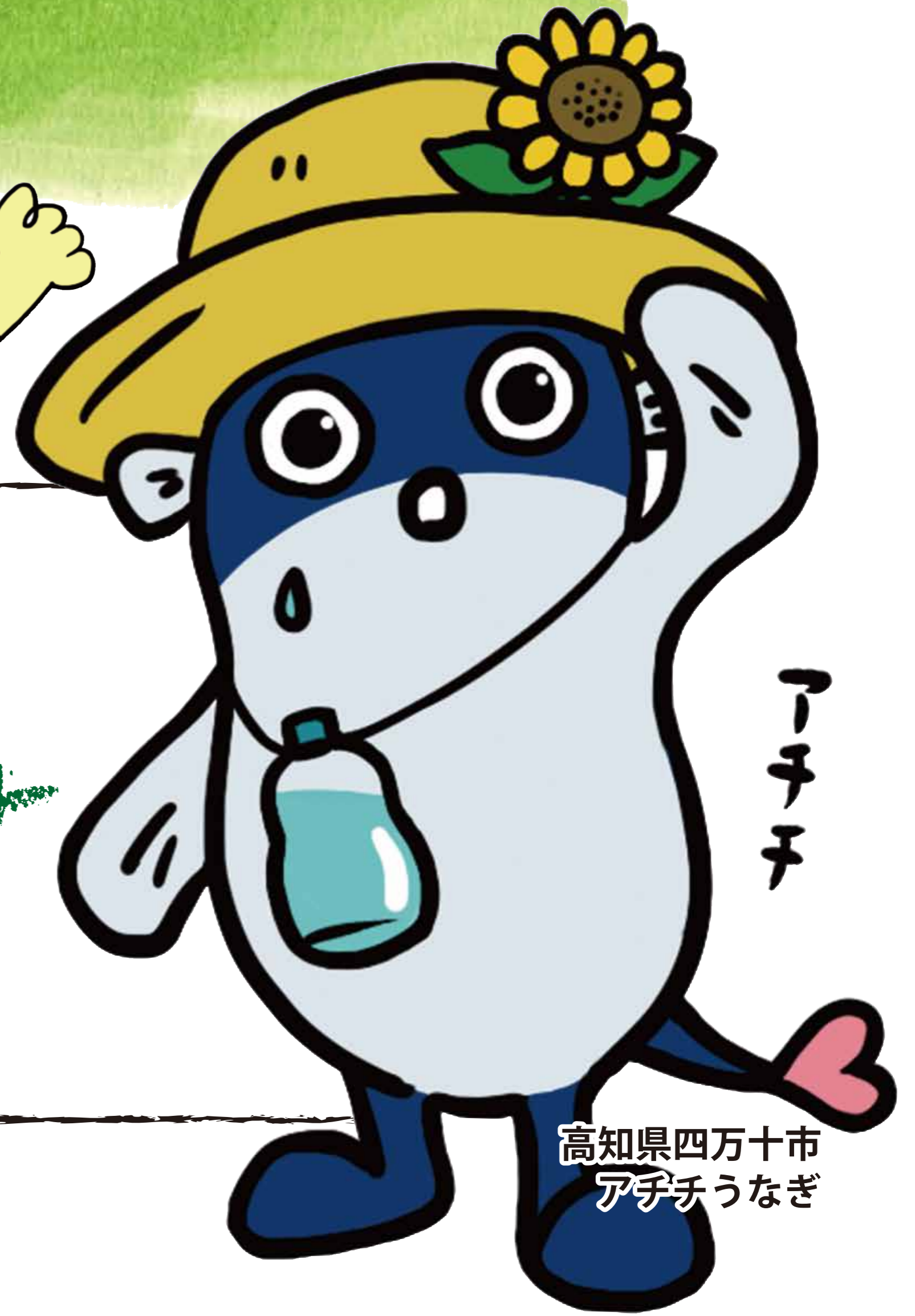
高知県四万十市 アチチうなぎ