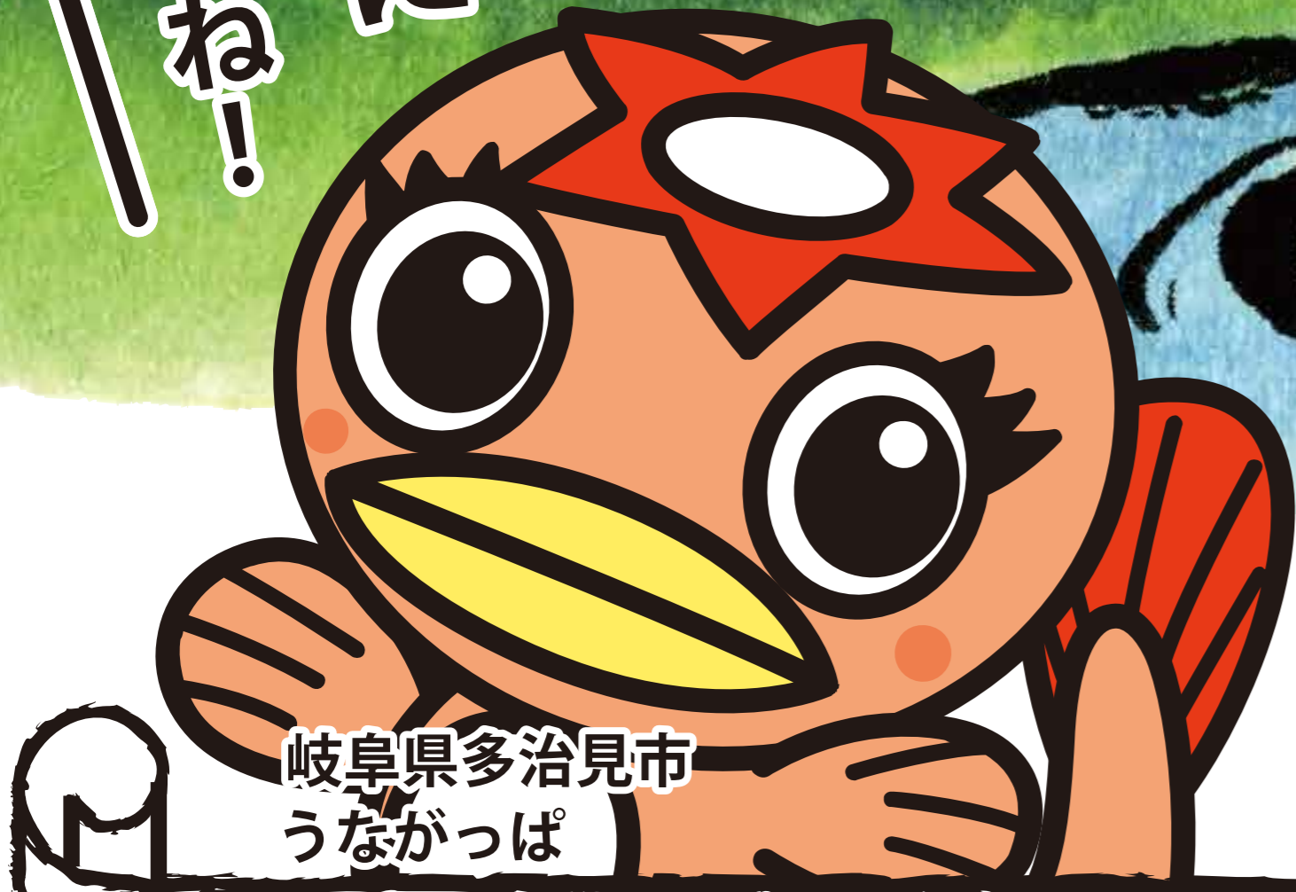
岐阜県多治見市 うながっぱ