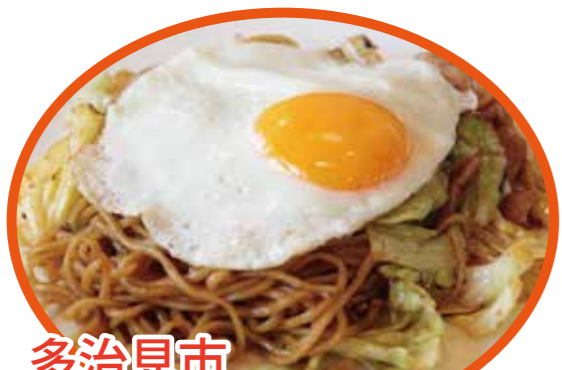
多治見市 たじみそやきそば