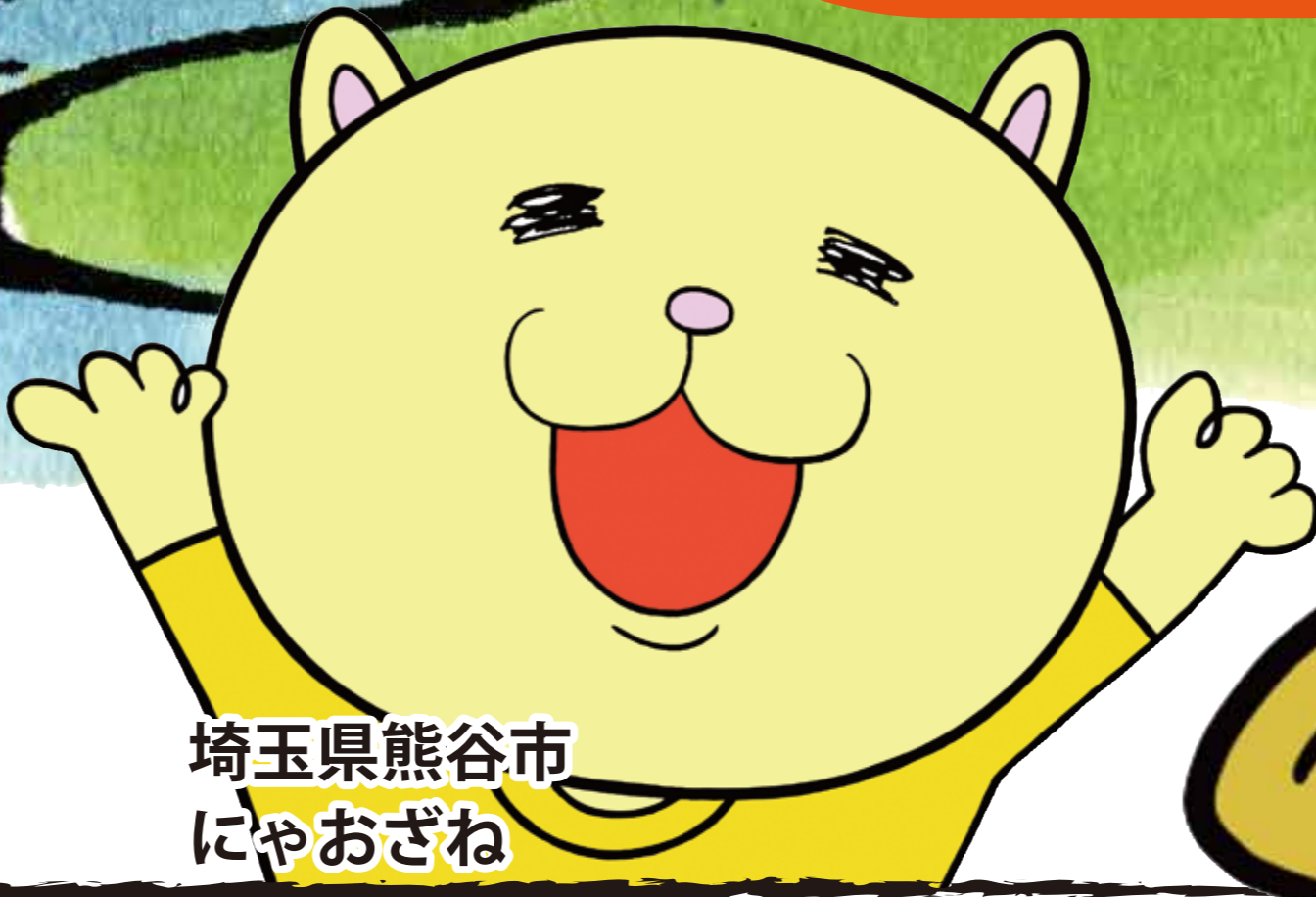
埼玉県熊谷市 にやおざね