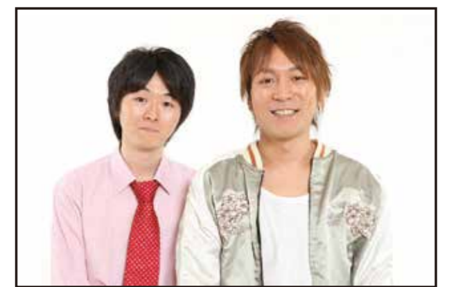
スーパーマドンナ

※ライブは有料になります。詳しくはチラシをご覧くださいか、四万十西土佐商工会までお問い合わせください。