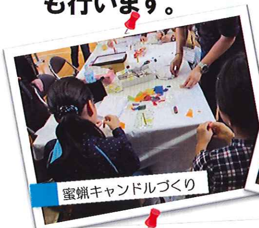
蜜蝋キャンドルづくり