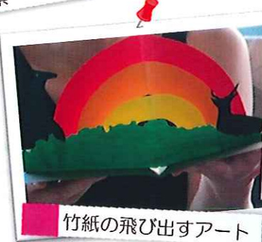
竹紙の飛び出すアート