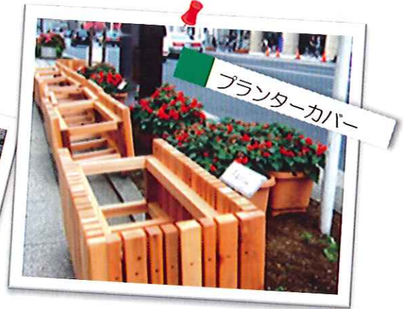
プランターカバー