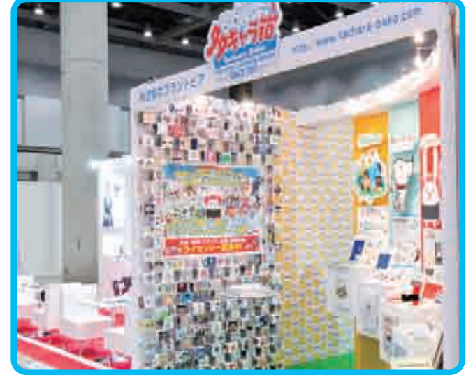
第2回ライセンシング・ジャパン (東京ビッグサイト)