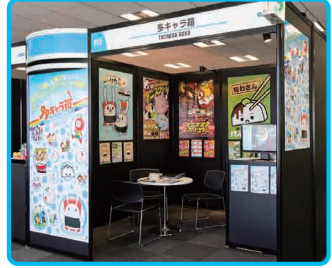
CREATIVE MARKET TOKYO 2011 (六本木ヒルズ)

多キャラ箱は展示会などにも出展し、登録キャラクターのプロモーション活動を行っています。