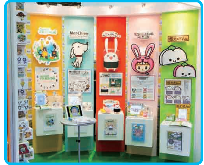
第74回東京国際ギフトショー秋2012 (東京ビッグサイト)