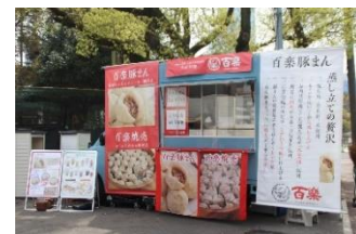
近鉄リテーリング <キッチンカー・ irodori kintetsu 商品の販売>