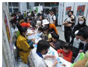
明日香村 <飛鳥時代の石造物の粘土細工 ワークショップ体験>