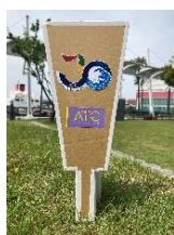
咲洲・南港 ATC <アップサイクルで 「はねつき」体験>