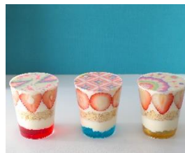
橿原市 <新ご当地グルメ「かしはら HI! チーズグルメ」の紹介>