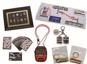
近畿日本鉄道 <グッズ販売・子ども制服写真撮影>