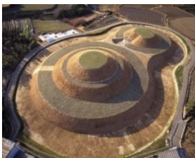
河内町 <古代のロマンを感じる古墳等の紹介や、 苺やイチジク等の加工品の販売>