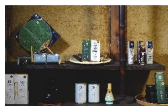
四日市市 <泗水十貨店のお菓子や雑貨の販売>