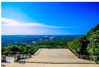
伊勢志摩 <新サービス「ぶらりすと」を使った プチデジタルスタンプラリー> *写真：横山展望台