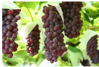
羽曳野市 <ブドウやイチジクの加工品販売>