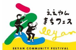
ええやんまちフェス <あべの・天王寺で働く人が 選ぶ「じぶんどこ以外で」 オススメなお店紹介>