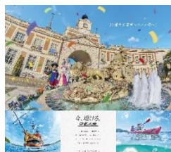
近鉄レジャークリエイティブ <伊勢志摩PR>