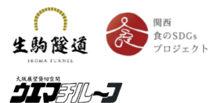
アド近鉄 <自事業の紹介>