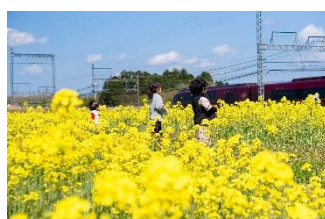
名張市 <伊賀米や伊賀酒、農産物の販売> *写真：近鉄線沿いの菜の花