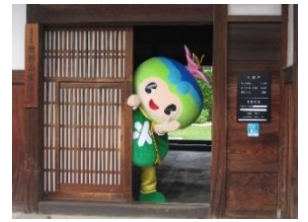
富田林市 <観光情報やふるさと 納税返礼品の紹介> *写真の“とっぴー”も登場