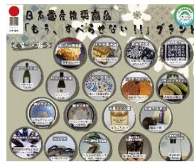
日本遺産「龍田古道・亀の瀬」推進協議会 <「龍田古道・亀の瀬」の紹介や 柏原市・三郷町の地場産品のPR・販売>