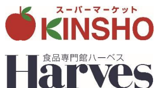
近商ストア <軽飲料(ペットボトル)や お菓子ほかの販売>