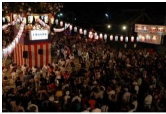
八尾市 <万博に向けた取り組み紹介や 八尾の枝豆の販売など>