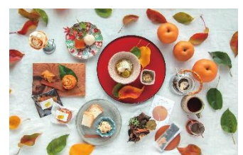
大淀町 <吉野らしい自然を感じる スイーツの紹介>