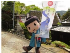
太子町 <野菜や果物の販売> *写真の“たいしくん”も登場