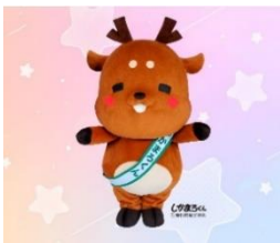
奈良市 <夏から秋のイベント紹介や 地酒の試飲> *写真の“しかまろくん”も登場