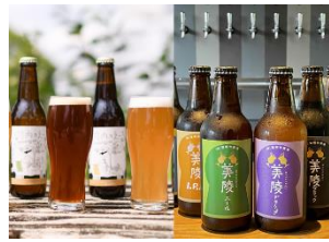
藤井寺市 <クラフトビールや 大阪産（もん）商品の販売>