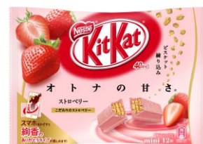
ネスレ キットカット ミニ オトナの甘さ ストロベリー12枚入