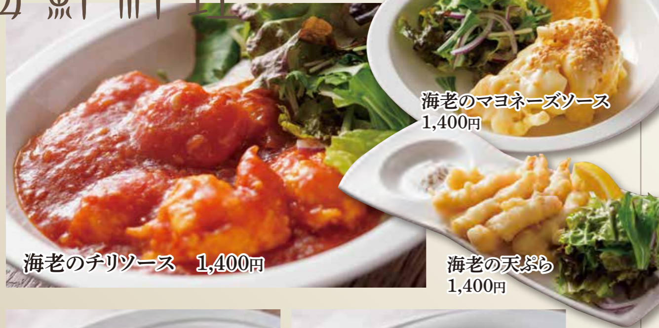
海老のチリソース 1,400円