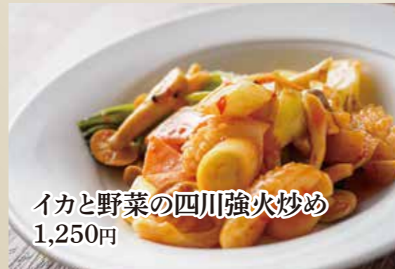
イカと野菜の四川強火炒め 1,250円