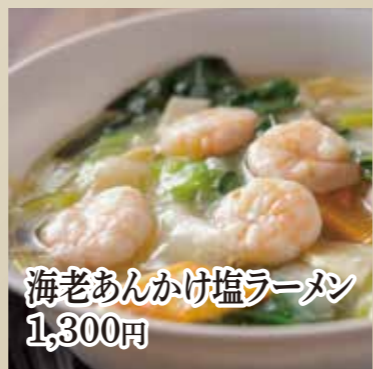
海老あんかけ塩ラーメン 1,300円