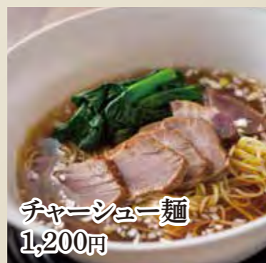
チャーシュー麺 1,200円