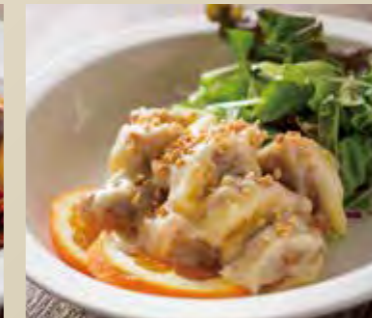
鶏肉のマヨネーズソース 1,250円