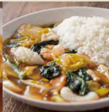
五目あんかけご飯 1,300円