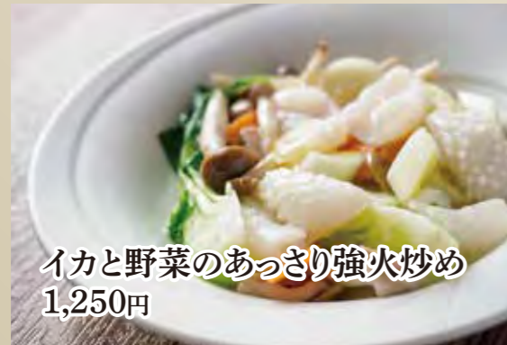
イカと野菜のあっさり強火炒め 1,250円