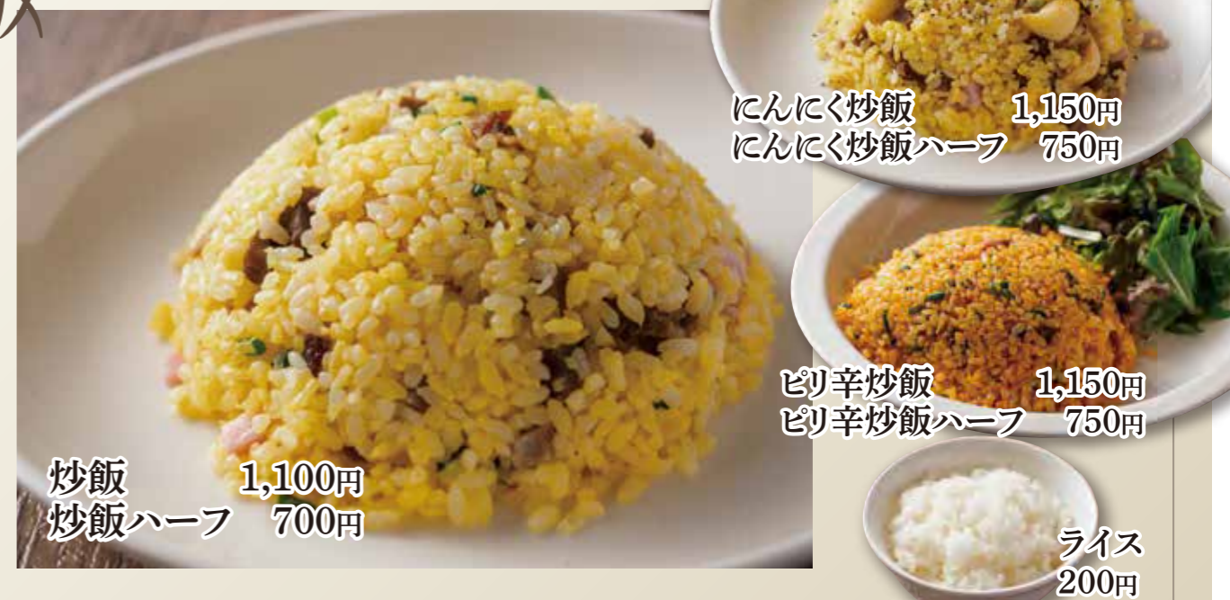
炒飯 1,100円 炒飯ハーフ 700円