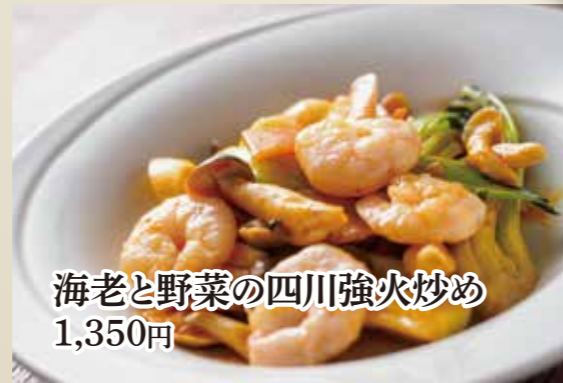
海老と野菜の四川強火炒め 1,350円