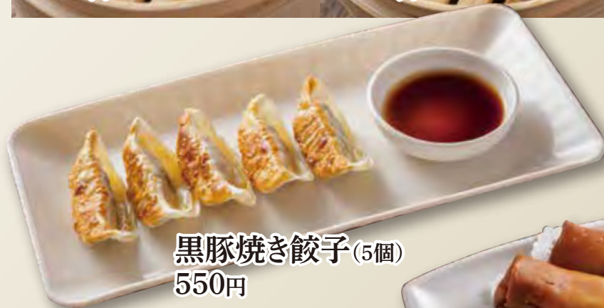
黒豚焼き餃子(5個) 550円