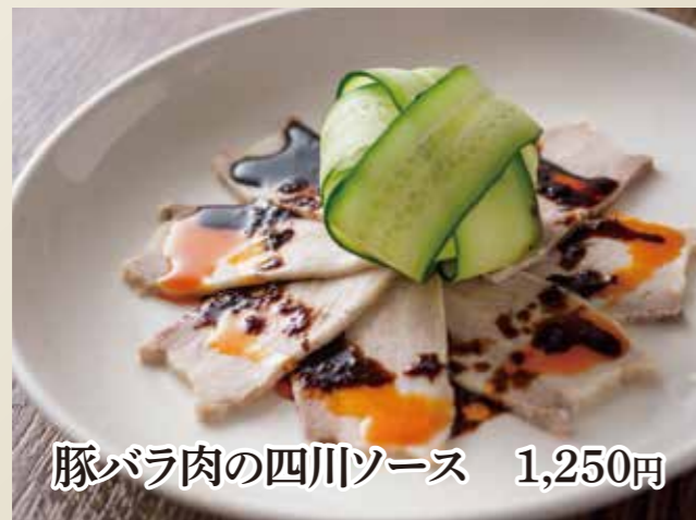
豚バラ肉の四川ソース 1,250円