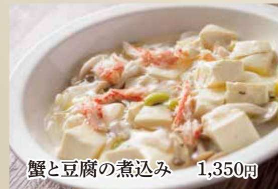
蟹と豆腐の煮込み 1,350円