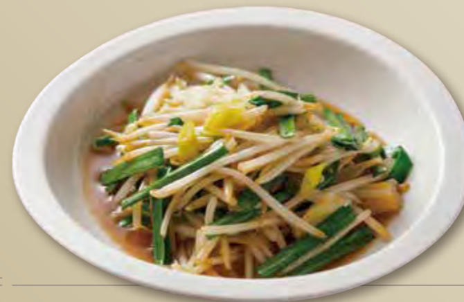
ニラともやしの強火炒め 950円