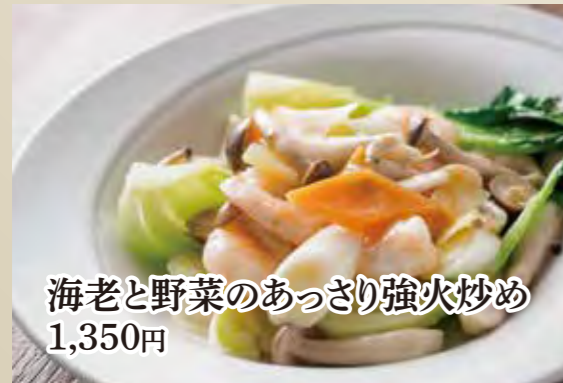
海老と野菜のあっさり強火炒め 1,350円