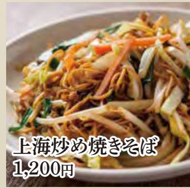
上海炒め焼きそば 1,200円