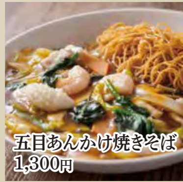
五目あんかけ焼きそば 1,300円