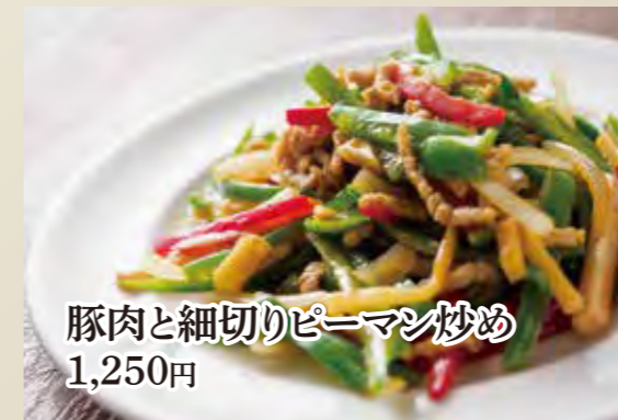
豚肉と細切りピーマン炒め 1,250円