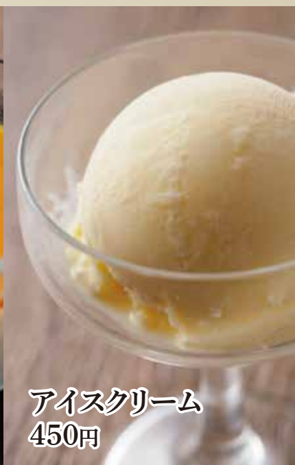
アイスクリーム 450円