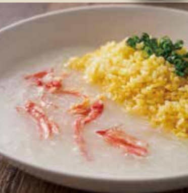
蟹肉あんかけ炒飯 1,300円