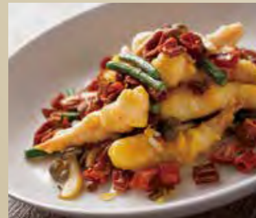
海老のヒーハー炒め 1,350円