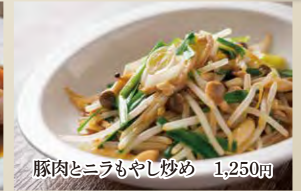
豚肉とニラもやし炒め 1,250円