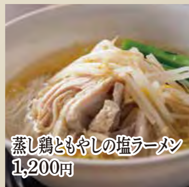
蒸し鶏ともやし塩ラーメン 1,200円