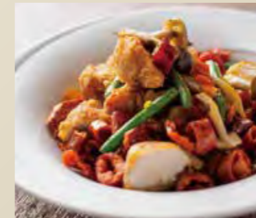
鶏肉のヒーハー炒め 1,250円