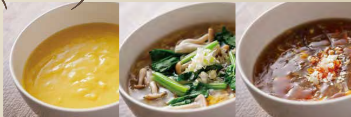
コーンスープ 650円 野菜と卵の優しいスープ 650円 酸辣湯 750円