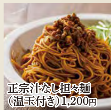
正宗汁なし担々麺 (温玉付き) 1,200円