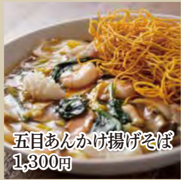
五目あんかけ揚げそば 1,300円