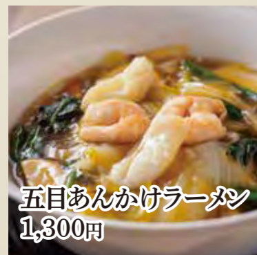
五目あんかけラーメン 1,300円