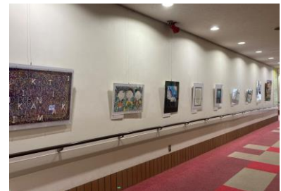
神戸リハビリテーション病院展示