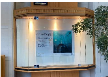
旧居留地ポスター展