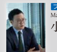
ファシリテーター

ケターキャリア協会理事及び女性複業支援企業等でキャリア支援活動も積極的に行う。著書に「アスリート×ブランド 感動と興奮を分かち合うスポーツシーンの作り方」(宣伝会議/2020年)、渋谷未来デザイン編・著書として「変わり続ける! シブヤ系まちづくり」(工作舎/2021年)。