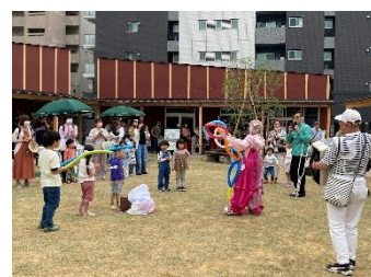
【バルーンアートグリーンティング】