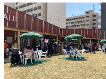
【青空フードコート】