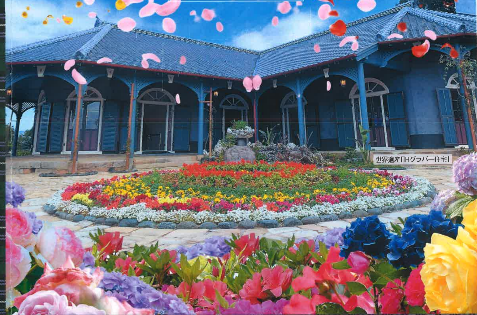
世界遺産「旧グラバー住宅」

2024.4.27 sat - 2024.5.5 sun 8:00~20:30 | 最終入園は20:10 |