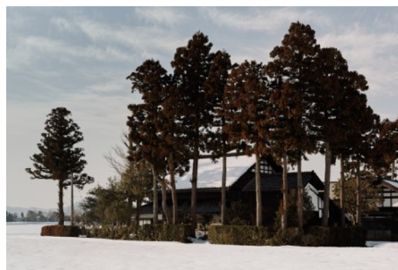
屋敷林（カイニヨ）と伝統的な「アズマダチ古民家」