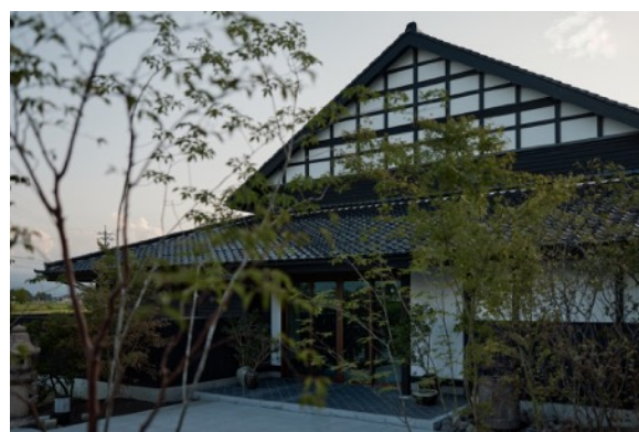
「アズマダチ古民家」を改修したアートホテル「楽土庵」

商品には散居村保全への寄付金も含まれており、森の中にいるような香りを楽しみながら、地域の ネイチャーポジティブ（自然再興） にも貢献できます。また、今後は富山県砺波市と連携し、より広く散居村の住民に剪定枝提供を募ることにより、生産量の増加と地域でカイニヨを守る機運の高まりにもつなげたいと考えています。