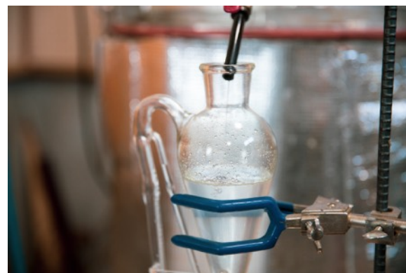
アロマセレクトでの精油抽出