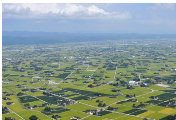
砺波平野の散居村