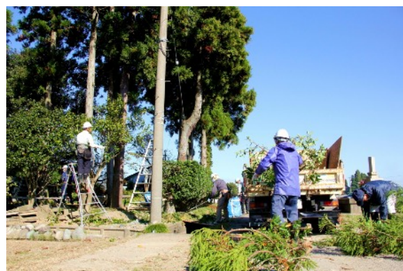
「カイニヨお手入れ支援隊」による屋敷林整備の様子