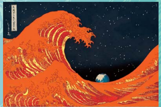
しりあがり寿「ちよつと可笑しなほほ富嶽三十六景 太陽から見た富士山」(通期) © SHIRIAGARI Kotobuki ※特に記載がない作品はすみだ北斎美術館蔵。

2024年7月3日、20年ぶりに新紙幣が発行されます。そのうち千円札の裏面に北斎の「富嶽三十六景 神奈川沖浪裏」が図柄として採用されます。本展は新紙幣採用を記念して、「富嶽三十六景 神奈川沖浪裏」がどのような背景で誕生したか、またその図柄がさまざまに利用されてきた軌跡をたどり、海外で「グレートウェーブ」の通称で親しまれる影響、広がりをご紹介します。