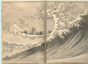
葛飾北斎「富嶽百景」二編 海上の不二(通期)