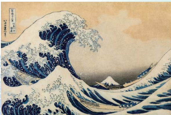
葛飾北斎「富嶽三十六景 神奈川沖浪裏」(通期) ※半期で同タイトルの作品に展示替えます。