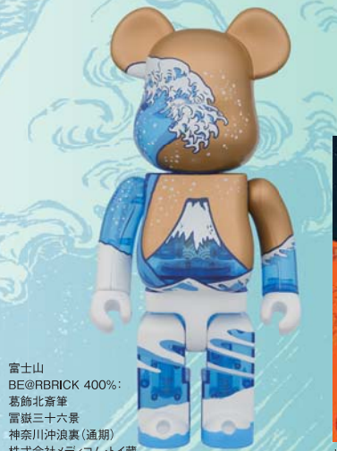
富士山 BE@RBRICK 400%: 葛飾北斎 富嶽三十六景 神奈川沖浪裏(通期) 株式会社メディアコム・トイ蔵 BE@RBRICK TM & © 2001-2024 MEDICOM TOY CORPORATION. All rights reserved.