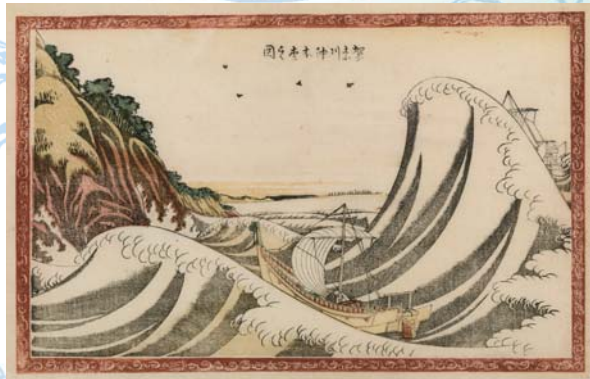
葛飾北斎「賀奈川沖本寺之図」(前期) ※表面のデザインには「富嶽三十六景 神奈川沖浪裏」と「富嶽百景」二編 海上の不二を使用しています。