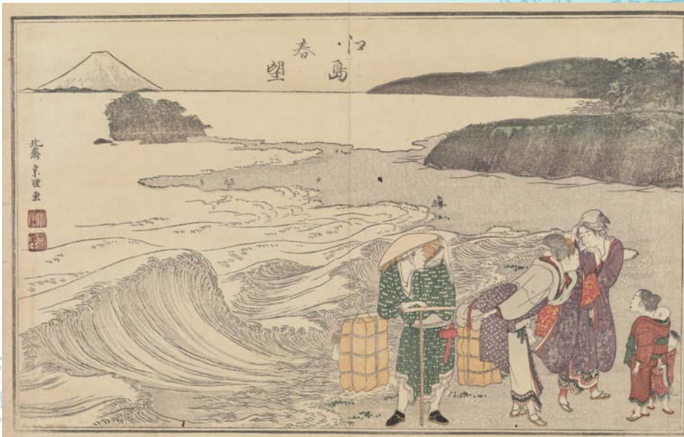
葛飾北斎「柳の糸」江島春望 慶應義塾蔵(6/18~7/3展示)