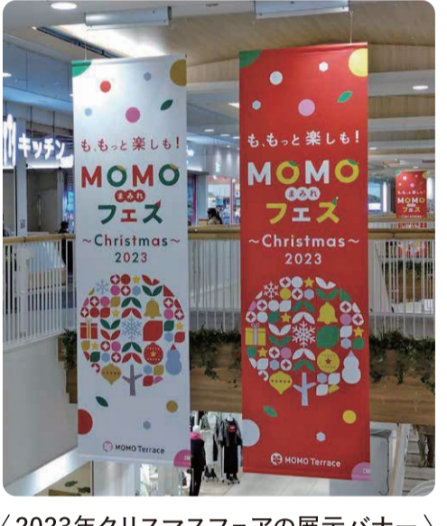
(2023年クリスマスフェアの展示バナー)