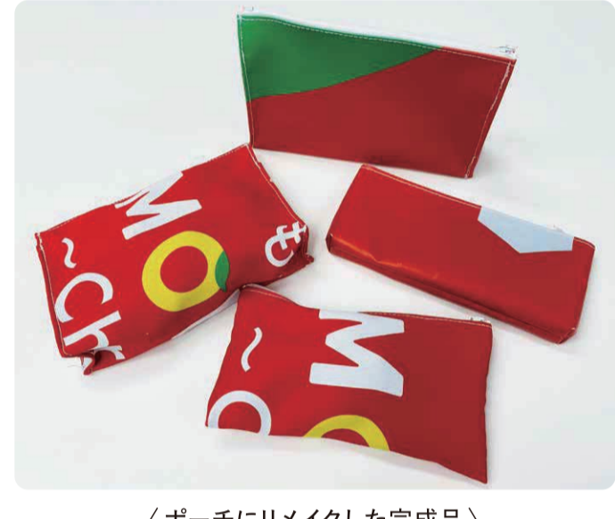
(ポーチにリメイクした完成品)