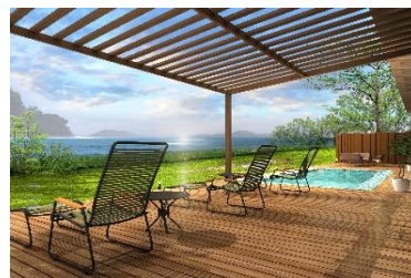
【プライベートプール】