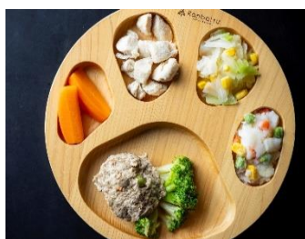
【ワンちゃん用お食事】