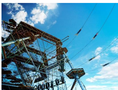
【タワー型アスレチック】