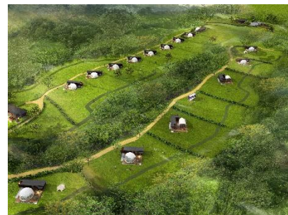
【グランピングフィールド】

グランピングにご宿泊のお客様は、 無料で「アトラクションフィールド」にご入園いただけます。