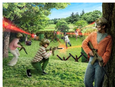
【屋外型サバイバルゲーム】