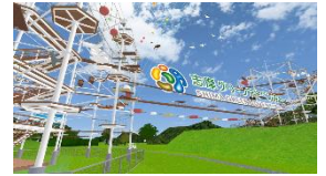
【タワー型アスレチック】