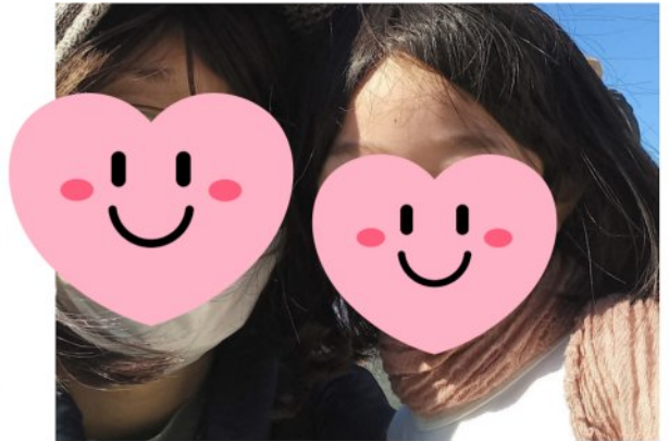
写真は治療で不安な時の支えになってくれた娘との写真です！

乳がん告知から不眠症になってしまったため、リカバリーウェアを着て少しでも体を休めたいと思います！