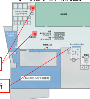
スタンプラリースポット