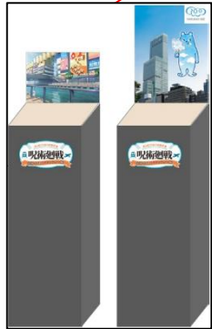
【ぬい撮りコーナー】