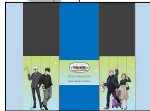
【エレベーター装飾（60階）】