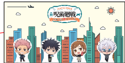
【デフォルメパネル】